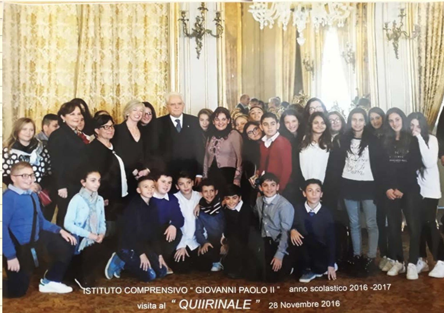
ISTITUTO COMPRENSIVO " GIOVANNI PAOLO II " anno scolastico 2016 -2017 visita al " QUIRINALE " 28 Novembre 2016